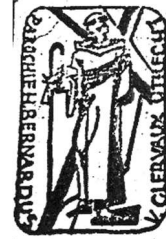
stempel van de voormalige Sint Bernarduskerk