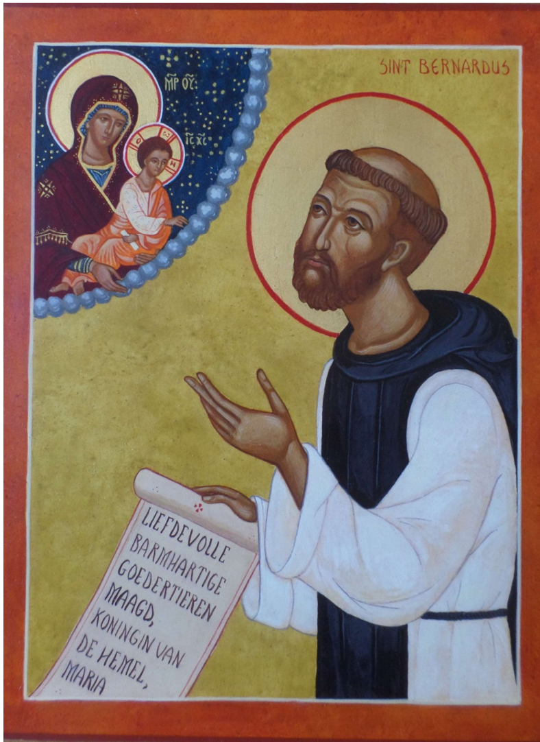
icoon van Bernardus door Madeleine Bogaerts