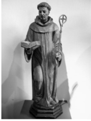
Sint Bernardus (Catharijneconvent)