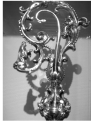
de krul van de abstaf van Sint Bernardus (Catharijneconvent)